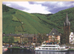
Bernkastel an der Mosel

Unsere vom Deutschen Fremdenverkehrsverband mit 4 Sternen ausgezeichnete Ferienwohnung befindet sich im Haus St. Briktius Weg 11 - separater Zugang - ruhige Wohnlage; Bäckerei, Metzgerei nur 200 Meter entfernt. 20qm große Südterrasse und eine Liegewiese mit wunderschöner Aussicht.