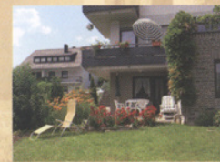
Sonnenbaden auf der gemütlichen Terrasse