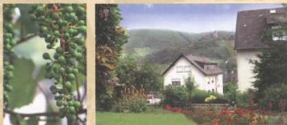
Stilleben / Traumhafter Ausblick auf die Stadt

In unserem Haus finden Sie eine persönliche und freundliche Atmosphäre. Unsere Ferienwohnung ist geschmackvoll aufeinander abgestimmt und komfortabel eingerichtet, mit Dusche und WC ausgestattet, mit Terrasse und einem wunderschönen Blick auf das Stadtpanorama.