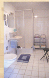
Ein Blick ins Bad

Parkplatz für PKW ist vorhanden. Abstellplatz für Fahrräder stellen wir auch gerne kostenlos zur Verfügung. Weinprobe ist im Familienweingut Hoffmann-Denzer nach Absprache möglich. Besuchen Sie uns doch mal im Internet auf hoffmann-denzer.de